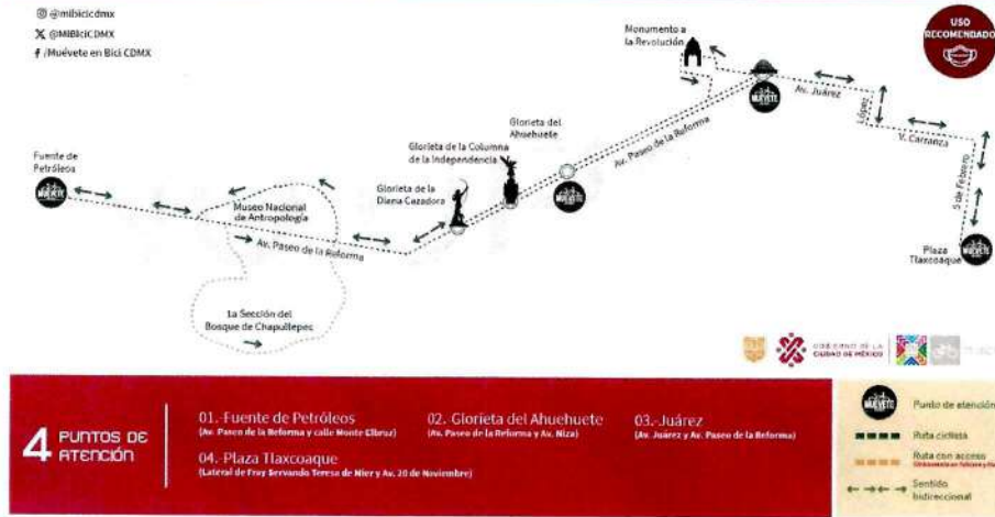
Mapa de la ruta Nocturna

“Por casos fortuitos, de fuerza mayor o contingencia puede cambiar la ruta u horario, información que se hará de conocimiento al Prestador de Servicio”