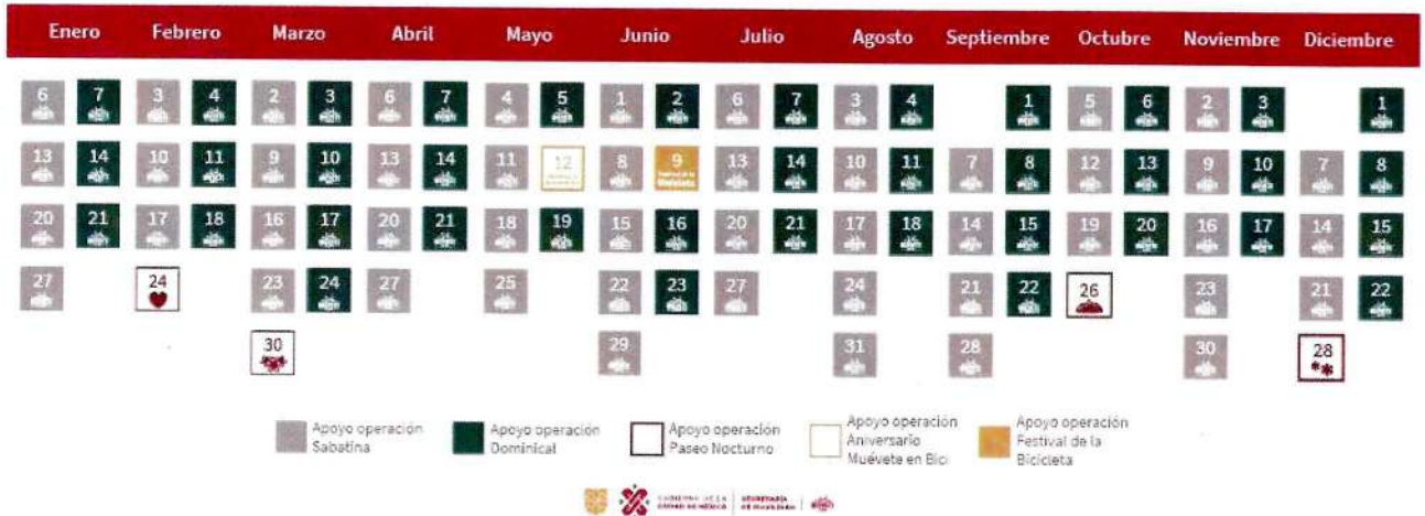
Calendario de Eventos y Apoyos a la Operación

Cabe señalar que se realizarán mesas de trabajo coordinadas por el área requirente previo a la puesta en marcha de las actividades, por lo cual el Prestador del servicio deberá estar disponible en horarios a convenir con el Área Técnica. Así mismo se tendrán reuniones y capacitaciones con el personal de apoyo a la operación entre semana o sábados con la finalidad de solventar incidencias del paseo anterior, esto bajo la coordinación del área requirente.