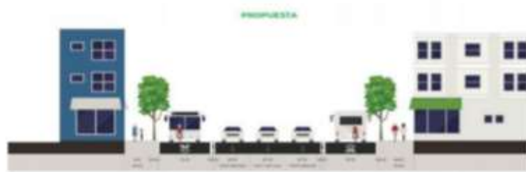
EJE 2 SUR QUERÉTARO / DR. OLVERA